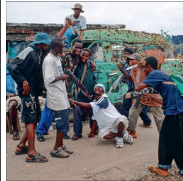
Hubschrauber aus Badelatschen von „General Scarborough“ (15) aus Monrovia