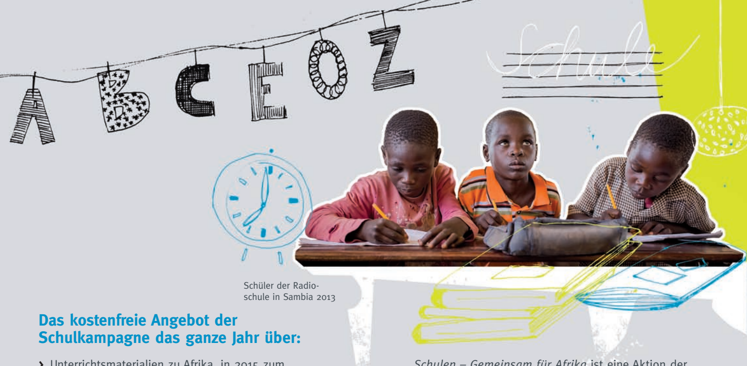
Schüler der Radioschule in Sambia 2013