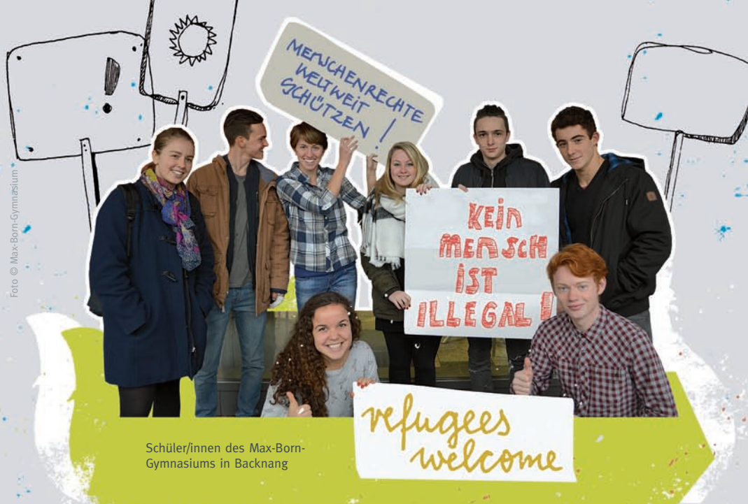
Schüler/innen des Max-Born-Gymnasiums in Backnang