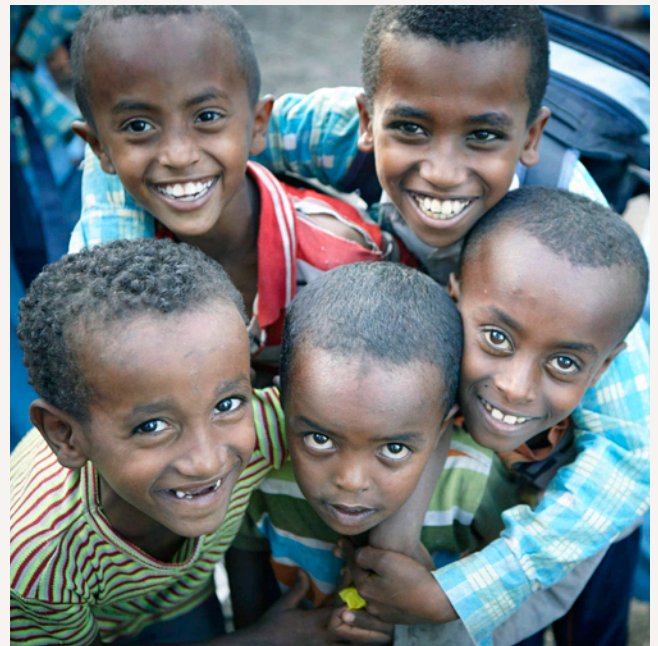
Neugierig umringen uns dutzende Kinder, die unbedingt von uns fotografiert werden wollen.