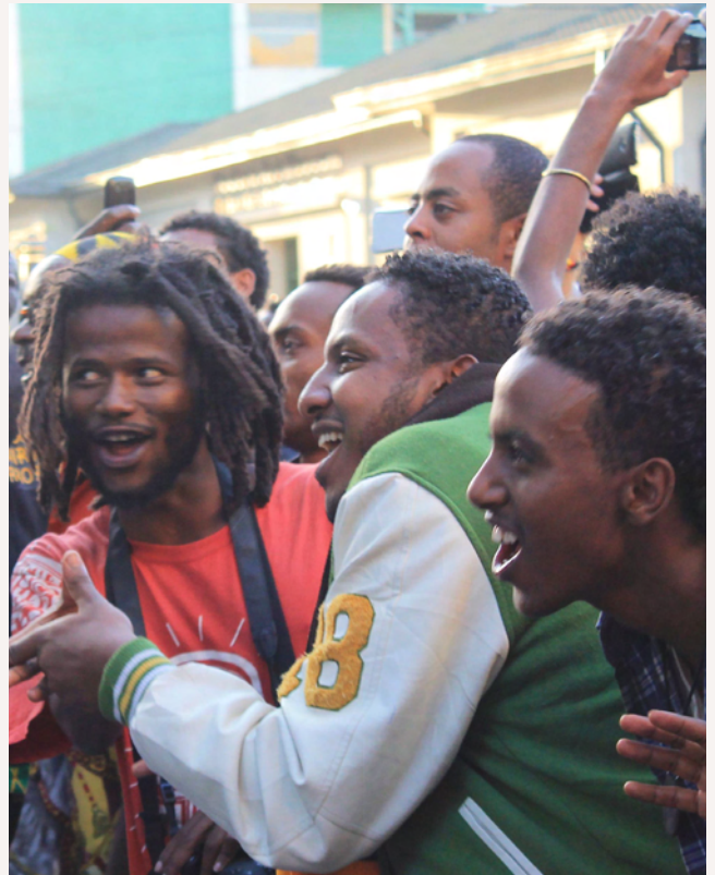
Das Publikum ist textsicher und geht bei fast allen Songs voll mit.

Erst als die Sonne längst untergegangen ist und Zugabe über Zugabe erklang, endet das Konzert. Alle fallen sich in die Arme, selbst die zuvor skeptische Chefin des Goethe-Instituts lacht erleichtert: „Alles steht noch...es war wunderschön“.