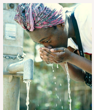
Ivy überzeugt sich von der Wasserqualität aus der neuen Pumpe in der Schule.