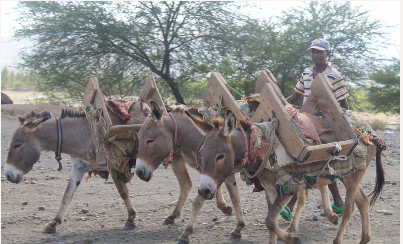
Eselherden, Kamele und Rinder gehören zu den weitverbreiteten Nutztieren der Landbevölkerung.