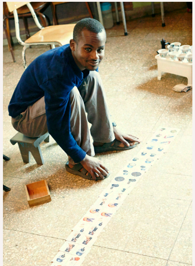
Die 28 Schritte der traditionellen Kaffee-Zeremonie lernen die Kinder mithilfe von Domino-Tafeln.

Auch hier klopfen wie an ein Tor, diesmal es ist bewacht, ein Wachmann soll die Mädchen vor unliebsamen Eindringlingen schützen. Doch niemand öffnet. Noch einmal: lauter. Wir hören kichernde Mädchenstimmen. Dann schwingt das Tor plötzlich auf, ein Lied erklingt und wir laufen durch eine singende Mädchengasse. 36 Mädchen zwischen sieben und achtzehn Jahren haben hier Zuflucht gefunden, hier finden sie Schutz und Fürsorge und können über ihre traumatischen Erlebnisse reden. Weitere 220 Mädchen, die auf der Straße arbeiten, erhalten finanzielle Unterstützung für ihre Familien.