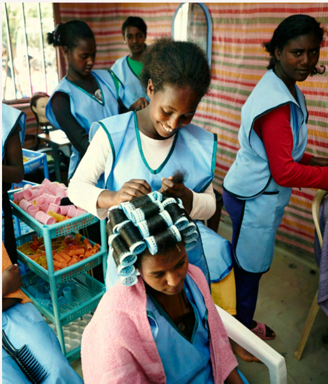
Im "Safe Home No.1" können die ehemaligen Straßenmädchen einen Ausbildungskurs als Friseurin machen.

Danach wird wie immer die Kaffeezeremonie zubereitet und in lebhafter Diskussion sitzen wir noch lange bei Kaffee und Popcorn – denn Popcorn gehört zum Kaffee unbedingt dazu.