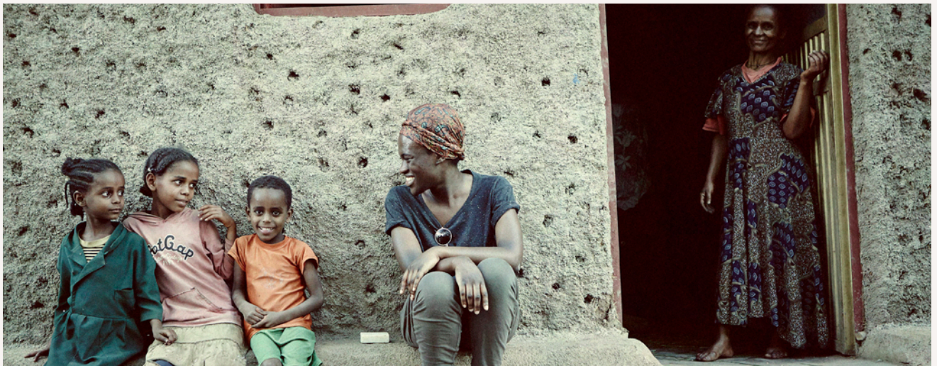
Nur mit Hilfe von Paten aus Deutschland können die Geschwister in die Schule gehen.

Zwei Stunden zurück im Dauerstau nach Addis, abends noch im 35 Jahre alten Skoda-Taxi in den ältesten Jazzschuppen der Stadt, dem Jazzamba im Altstadtviertel, in dem bekannte und unbekannte Musiker ein buntes Publikum begeistern.