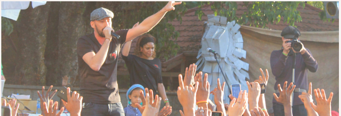
Bis weit in den Abend hinein singen und tanzen Familien und begeisterte Besucher.