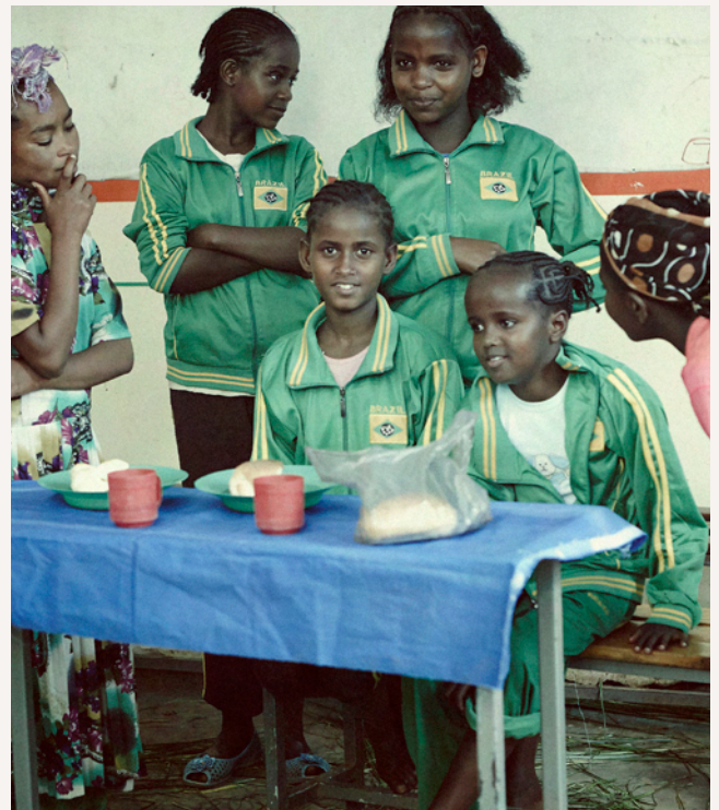
In Rollenspielen verarbeiten die traumatisierten Mädchen ihre Gewalt- und Missbrauchs-Erfahrungen.