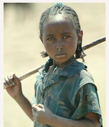
Das Vieh zu hüten, ist tägliche Aufgabe von Mädchen und Jungen.